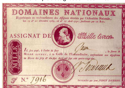
Document 4 Un exemple d'assignat de 1 000 livres