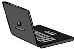
Ordinateur portable 1 200 €