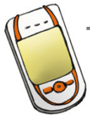
Téléphone 129,90 €

■ La réduction correspond à un tiers de son prix d'origine. Vrai Faux