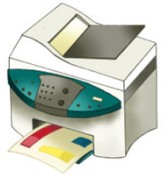
Imprimante 100 €