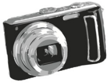
Appareil photo 160 €