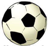
Ballon de foot 10 €