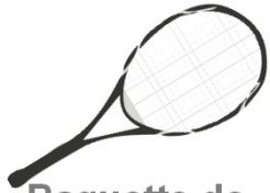
Raquette de tennis 25 €