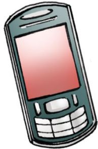
Sumsom K3X Prix : 67 €